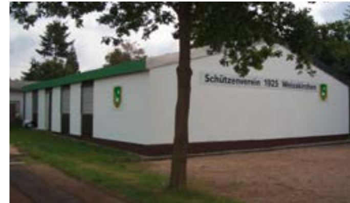
Schützenhaus des Schützenverein 1925 Weißkirchen/Ts. e.V.